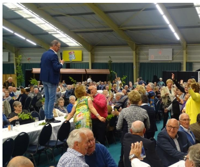
Ter herinnering aan het 50-jarig bestaan