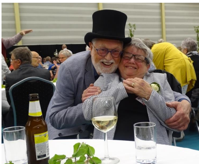
Onze voorzitter en penningmeester