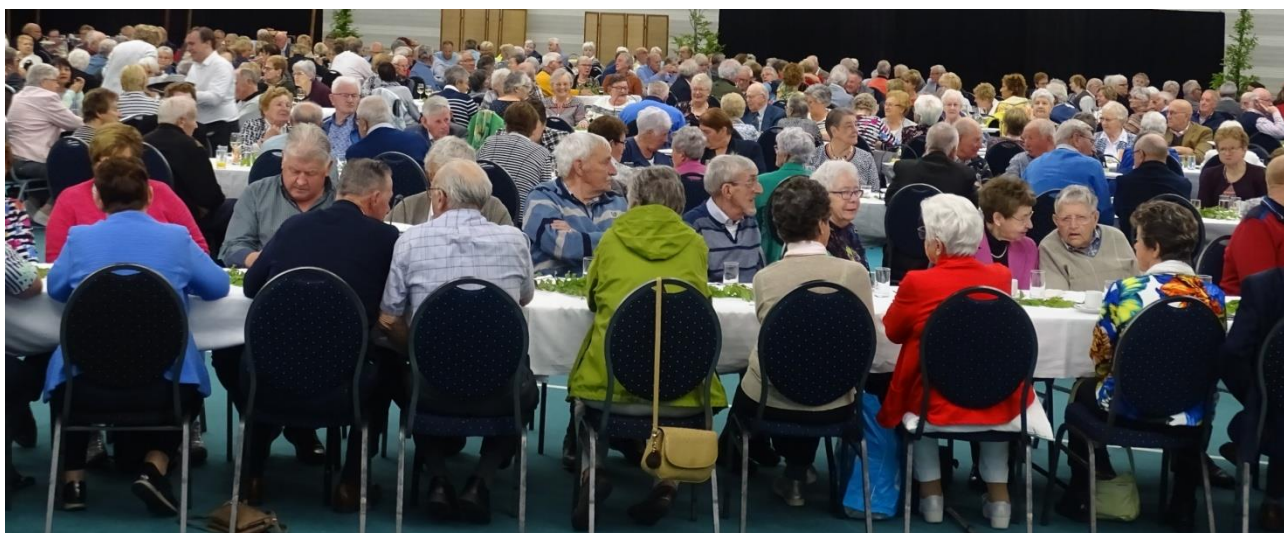
Toen konden we nog feesten

Met het beheer van het Cultuurcentrum is, rekening houdend met de verplichte 1,5 m. afstand, bekeken hoeveel personen er in de zaal kunnen plaatsnemen en dit is plusminus 40.