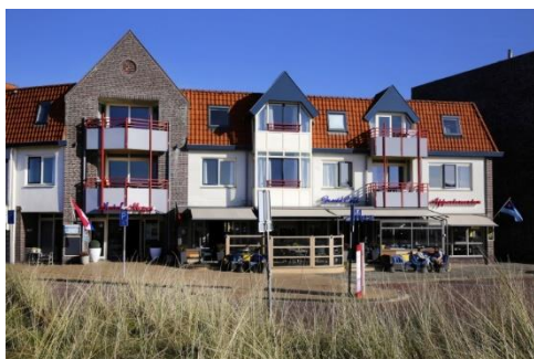
Hotel Meyer in Bergen aan Zee

Nog nagenietend van de reis naar de Moezel heeft de werkgroep 'meerdaagse reizen' alweer bekeken waar de reis het volgende jaar naar toe zal gaan. En dit keer is gekozen voor een reis binnen Nederland, en wel naar de prachtige provincie Noord-Holland én op het grootste Nederlandse Waddeneiland Texel! De reis staat gepland voor 31 mei t/m 3 juni 2022.