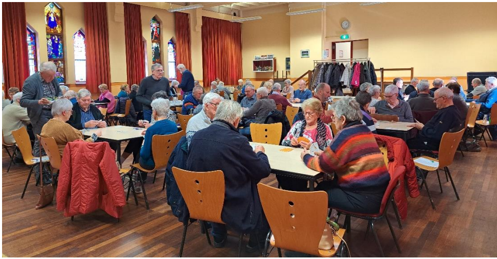
De start van het rik- en jokertoernooi