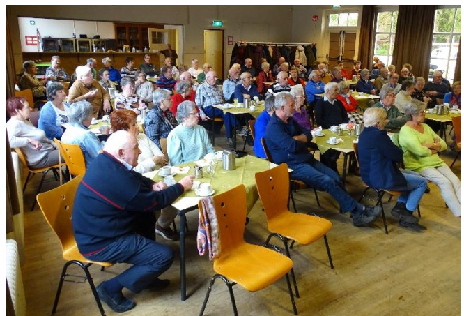
Altijd een gezellige, ongedwongen sfeer