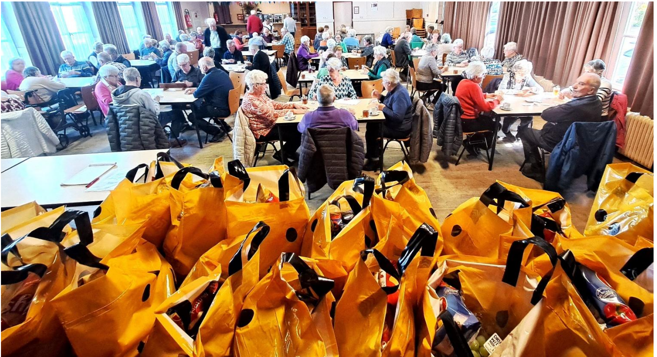
Ook dit jaar liggen de prijzen te wachten op het Rik- en Jokertoernooi